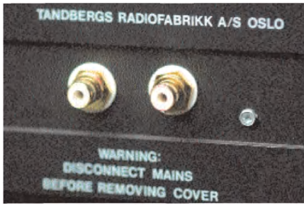
Liten modifikasjon med stor betydning.