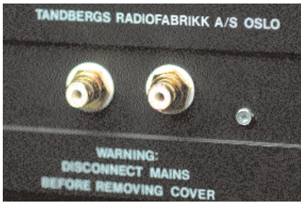
Liten modifikasjon med stor betydning.