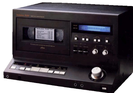
Technics SV-P100. Digitalt kassettdäck. Svaj: 0% (ovägd siffra). Frekvensomfång: 2 Hz-20 kHz (±0,5 dB) Distorsion vid full utstyrning: mindre än 0,01%. Dynamik: mer än 86 dB. Ca 30.000,-

SL-P10 är vår tungviktare och kan bland mycket annat också skryta med mycket avancerade programmeringsvarianter.