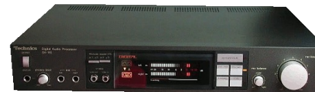
Technics SV-110. Digital audio processor avsedd för stationärt bruk. Kommer i januari. Ca 9.000,-

that sacrifice in return for the kind of sound and the level of performance that this magnificent CD-player delivered."