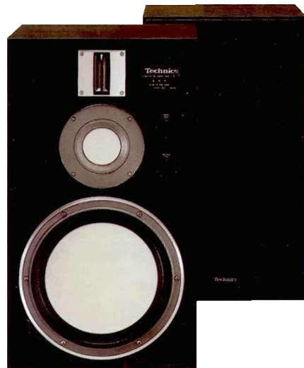
Technics SB-10. 3-vägs bikakehögtalare. Technics bikakor är speciellt utvecklade för att klara de mycket höga krav digital- tekniken ställer. Lysna och njut. Ca 9.000,- parst

"Vi fick titta upp och förvissa oss om att denna underbara musik verkligen kom från högtalare."