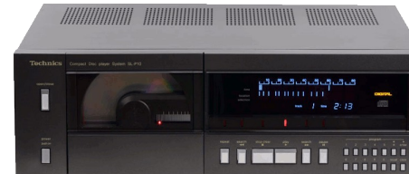
Technics SL-P10. Tungviktaren i CD-programmet har mycket avancerade programmeringsvarianter. Ca 10.000,-