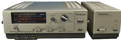
Technics SV-100. Digital audio processor, som gör en vanlig videobandspelare till ett fullfjädrat digitalt kassettdäck. (Själva processorn är alltså till vänster på bilden, till höger är själva nätdelen till processorn.) Ca 9.000,-