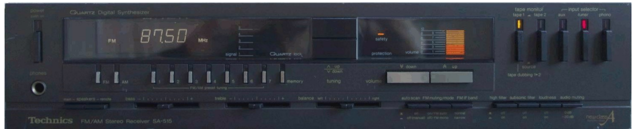
SA-515. RECEIVER 2 x 50 W MED DIGITAL, SJÄLVSÖKANDE RADIO. Förstärkardel I nya Klass A. 0,02 % total harmonisk distorsion vid full uteffekt. 50 W. Kvartskristallstyrd radiodel som automatiskt söker upp stationer med mer än 6µV signalstyrka. Förinställning på 14 olika stationer. Alternativ inställning av MF-bandbredden, normal/small. Volymkontroll med tryckknappar och variabel hastighet. Lyssindiodktering av volymnivå, signalstyrka, fäsläsning och inkopplad program källa. Dubbla bandspelningångar. Ca pris 2.700:-

Resultatet blir en smått genial kombination av fördelarna hos bägge dom gamla konstruktionerna. Verkningsgraden blir hög utan att det bildas onödig överskottsvärme som kräver dyra, skrymmande kylelement. Omkopplings- och övergångsdistorsionen försvinner. Den totala harmoniska distorsionen blir mycket låg (0,001-0,02%). Och det allra bästa: Kvalitetshöjningen som Nya Klass A medför märks inte på priset.