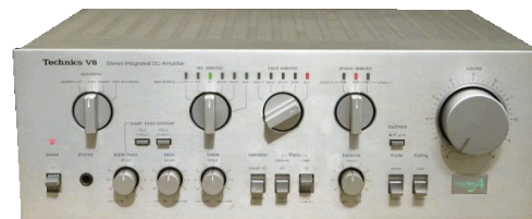
SU-V8. INTEGRERAD FÖRSTÄRKARE 2 X 105 W IEC. Uppbyggd enligt nya klass A. Extremt låg distorsion 0,007% THD vid full uteffekt. Två separata spänningsaggregat undanröjer all påverkan mellan höger och vänster kanal. Kompakt effektblock med minimala anslutningsavstånd till andra kretsar. Ren DC-koppling - förkopplingsbara tonkontroller. Ingång för MC-pickup. Separat bandspelarmkopplare för samtidig lyssning/bandning av olika programkällor. Extra tonkontroll för superbass kompenserar bastoner som annars inte skulle höras. Ca pris 3.000:-