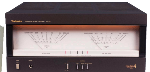
SE-A3. EFFEKTFÖRSTÄRKARE 2x200 W IEC. Effektförstärkare med Technics alla högs sofistikerade lösningar som ger tekniska data och lyssnarintryck i särklass. Uppbyggd enligt nya klass A. Inga kondensatorer mellan ingång och utgång som kan påverka signalen. Kompakt effektblock som minimerar elektromagnetiska störningar. Maximalt 0,001% distorsion från 20 till 20.000 Hz vid full uteffekt (8 ohm). Dynamik 123 dB IHF A. Stora toppvärdesvisande effektmätare. Skyddskrets med LED-indikator. Ca pris 8.000:-