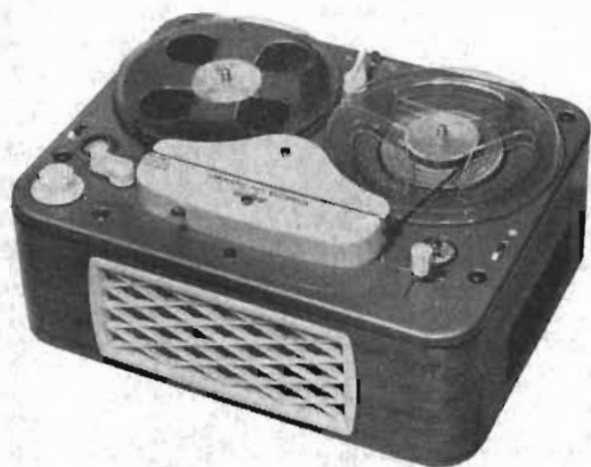
Modell 3 B från 1959