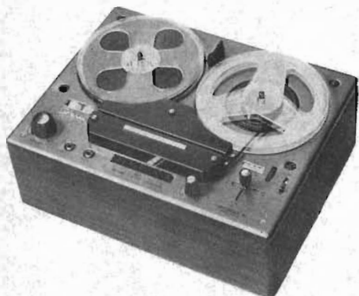
Modell 6 Stereo från 1961