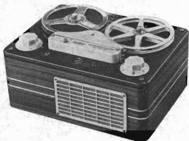
Modell IH från 1953