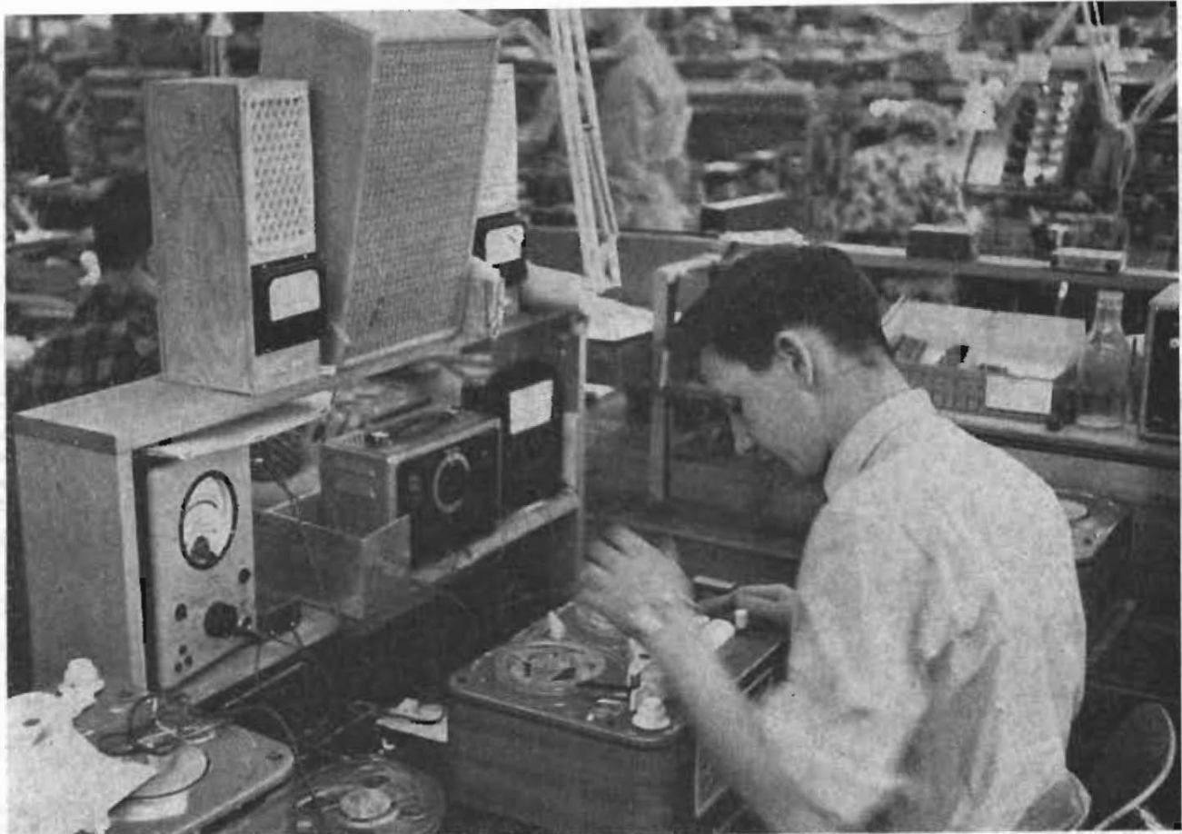
Tre olika modeller av Tandbergs bandspelare.

Beträffande exportmarknaden hyser man heller inga farhågor. Tandbergs bandspelare har hävdats sig väl i konkurrensen på så hårda marknader som de i USA, Sverige och England.