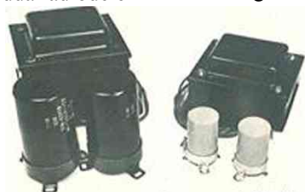
En del spar in med små transformatorer och elektrölyter. Pioneer är nog med basåtergivning och satsar på rejäla don.

Lika viktigt med den här bottenplattan är att den har ett speciellt ventilationssystem med fria