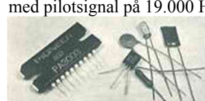
Somliga dämpar pilottonen med vanliga komponenter. Pioneer har utvecklat en speciell integrerad krets som tar bort den.

Pilottonen du aldrig hör Alla FM-stereostationer sänder sin musik med pilotsignal på 19.000 Hz. Om den inte dämpas, skapar den här signalen en irriterande hög ton när den sammanförs med andra frekvenser i t ex en bandspelare.