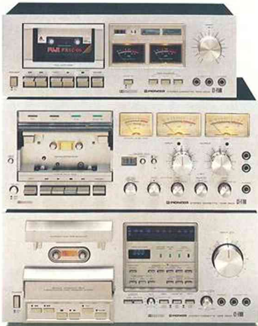
Pen nya generar/ono: k<n/cud<Uk Strfrån CT-f 900, CT-F 700, (T-F 500.

Med systemet Digitron blev det också möjligt att ge en synlig presentation av mikroprocessorns funktioner. En revolutionerande teknik som på ett instrument för ljusstyrning erbjuder enastående möjligheter att visuellt presentera nivåernas medelvärden och toppvärden. Till och med minnesfunktion! En enastående nyhet med aspekter som var för sig erbjuder specifika fördelar.