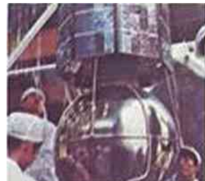
nen, radar, laser o. glasfiber-överföring. datortekniken, videofonen m.m