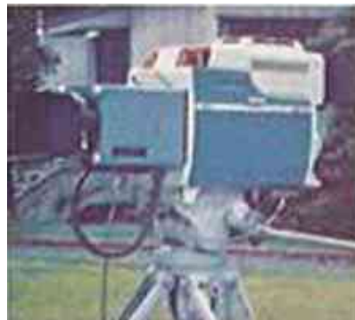
1977 NEC (60.000 anställda) utvecklar radio och TV-tck-niken, telekommunikatio-