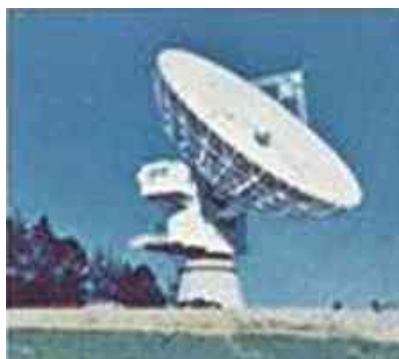
1967 NEC är störst i världen på satellit-kommunikation.