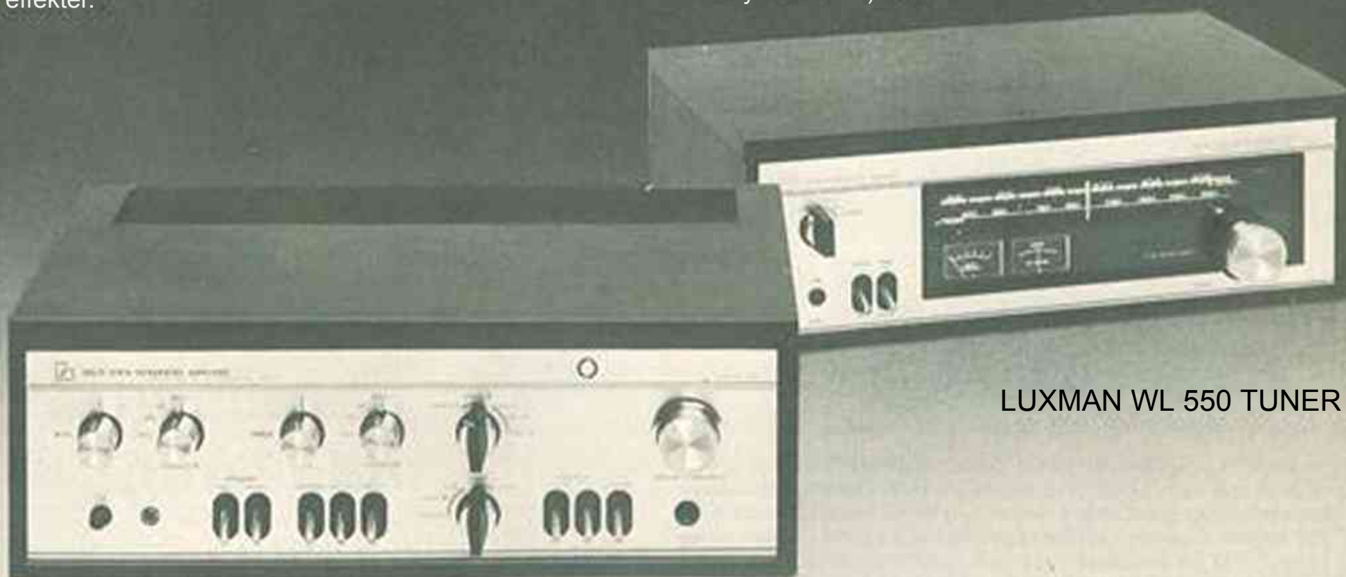
LUXMAN SQ 507 X FÖRSTÄRKARE

Tack vare att AM-delen är försedd med HF-steg och två-stegs MF-steg fås hög förstärkning och mycket god selektivitet. Bredbandiga MF-transformatorer åstadkommer en mycket god ljudkvalitet. För att reducera distortion vid höga signal-styrkor är WL 550 försedd med en mycket kraftfull A G C (Automatisk volym-kontroll).