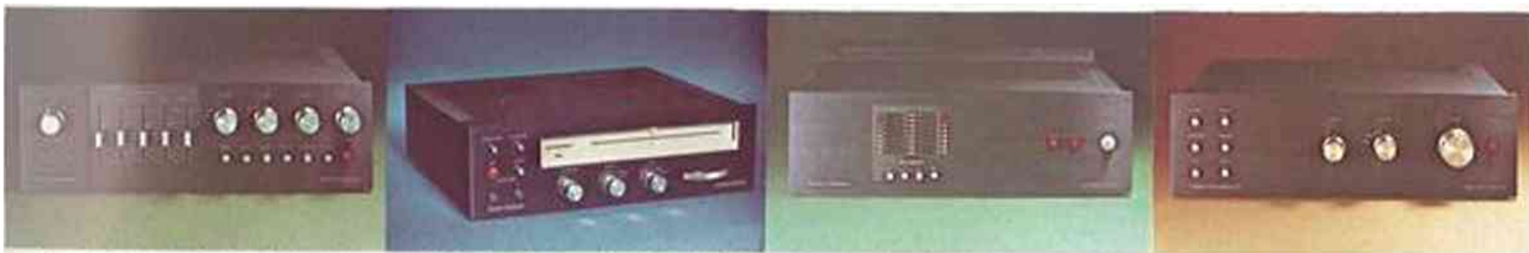
Citation 17. förförstärkare Bandbredd från under 3Hz till över 270kHz. -3dB Mindre än 0,001% THD. phonoförstärkare mindre än 0,002 THD Avvikelse från RIAA-kurva max 0,25dB