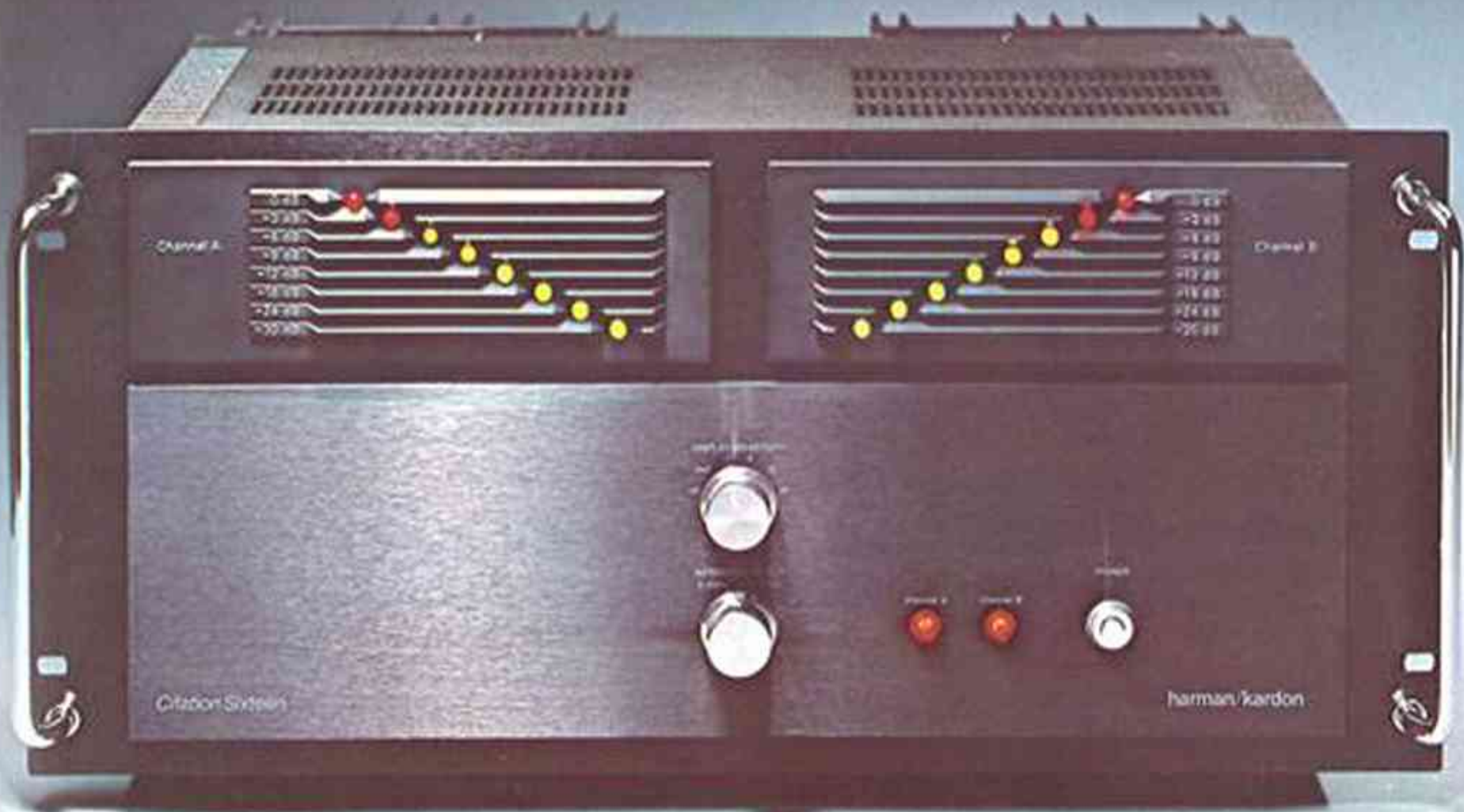
Citation 16a. effektförstärkare. 150W min. FTC vid 8 ohm. från 20 till 20 kHz med mindre än 0,05 THD. Bandbredd: Under 4 Hz till över 120 kHz. -3dB