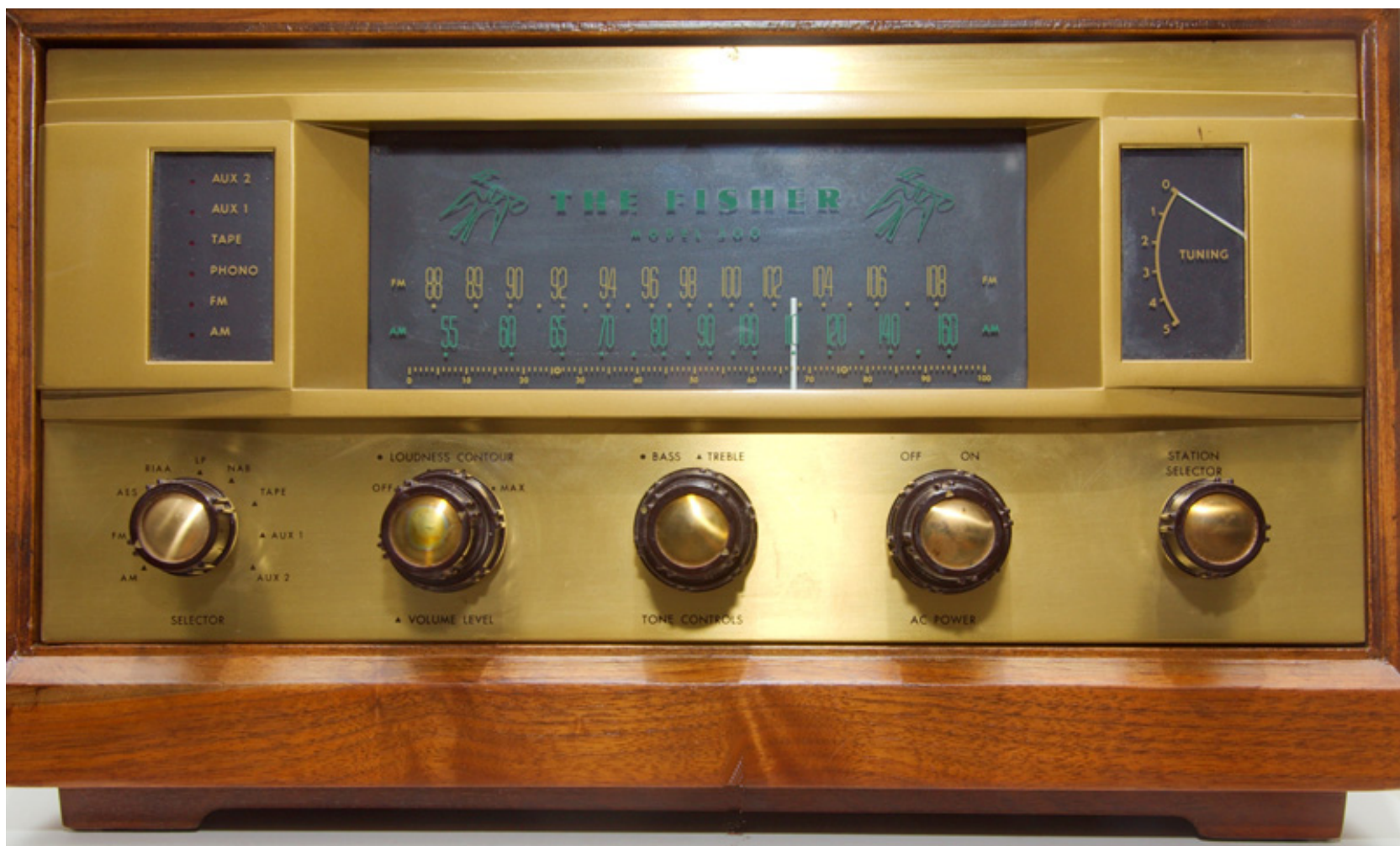
Fisher model 500

Några av de tidiga 1960 modellerna var också tillgängliga som byggsatser. Fisher rör-utrustade modeller är eftertraktade samlarobjekt idag.