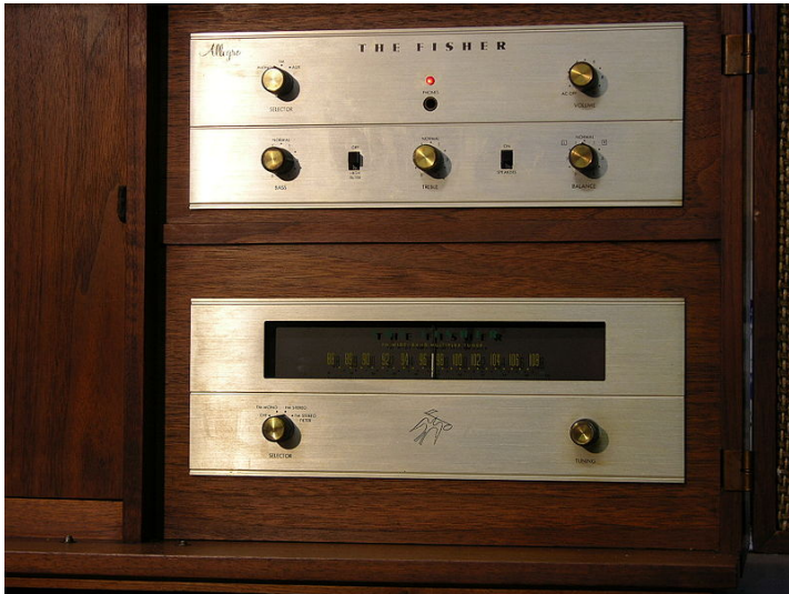
En ovanlig Fisher Allegro modell X19 Tube 20 Watt stereoförstärkare och matchande FM Multiplex Tuner Cirka 1962

Fisher användes också på Fishers tidiga USA-gjorda solid-state utrustning, såsom receiveern modell 210.