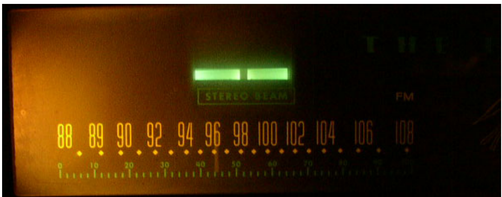
Fisher använde ofta Tuning Eye eller "Stereo Beam" och "Stereo Beacon" som här visas på Model 800B