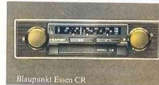
Blaupunkt Essen CR

Väljer du en stereo-radio är det viktigt att den har hög känslighet. Annars kan den inte återge de svagare stereosignalerna när den kommit en bit ifrån sändaren. En annan viktig faktor är avstörningen. Särskilt vid stereoomot-